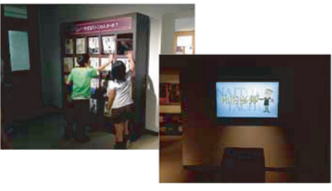
左は「ひらいて、まわして、やまなしのこの人だ〜れ?」 右はクイズ「ふるさと人物伝」

子ども向け展示のコーナーには、ひらいたりまわしたり、クイズゲームをしたりしながら、山梨の人々がやったことを知ることができます。全問正解めざしてがんばろう!