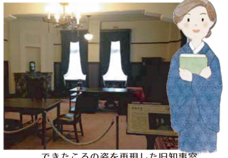
.....できたころの姿を再現した旧知事室。

きれいに再現されたむかしの知事室。山梨ならではの飾りを見つけてみよう。となりのむかしの応接室では、大きなパネルで山梨の歴史年表や歴代の知事さんをしらべることができます。