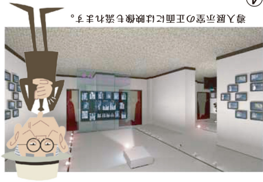
導入展示室の正面には映像も流れます。