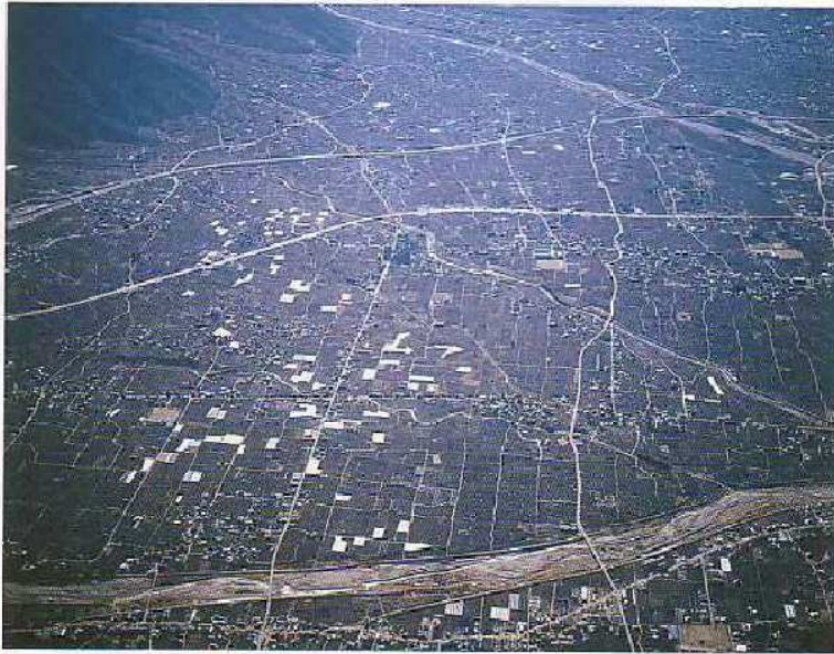
22 一宮町周辺に残る条里型地割り