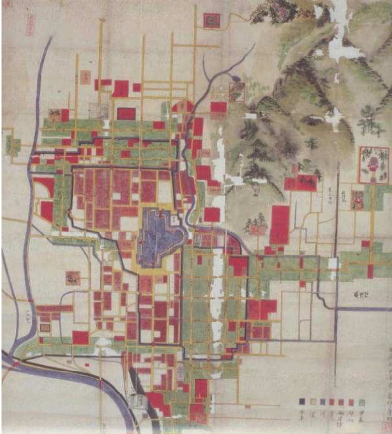
資料編9 口絵 甲府絵図