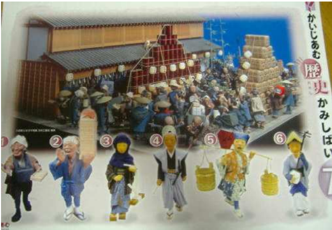
かいじあむ歴史紙しばい 7 「八日町ジオラマ写真」...表