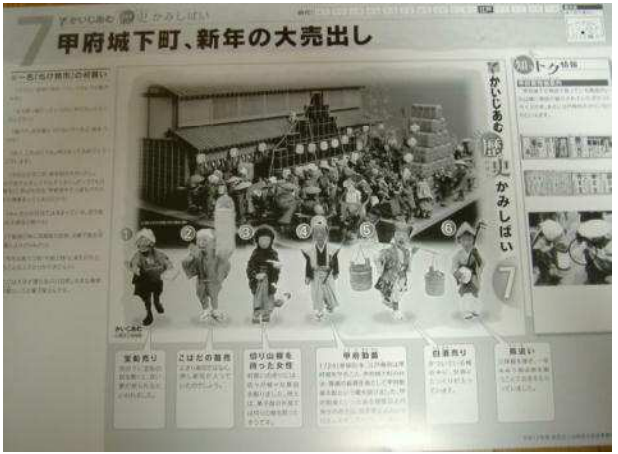
かいじあむ歴史紙しばい 7 「八日町ジオラマ写真」...裏