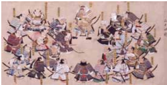
「武門便覧」武田二十四将図」当館蔵

甲斐国から全国有数の戦国大名に成長した武田氏。その発展は武田信玄の力だけではなく、多くの家臣の活躍によって実現しました。本展では、信玄を支えた家臣として著名な「武田二十四将」を中心に、彼らの古文書、武具や肖像などの関連資料をとおして、その実像に迫ります。また彼らの子孫が江戸時代以降にどのような活動をしてきたのかもあわせて紹介します。