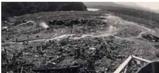
50年前の昭和41年に台風26号によって大きな被害を受けた足和田村(当時)

東日本大震災から5年が経過します。山梨における災害の歴史を通して、災害から生命や財産を守り、復興を遂げようとする人々の営みを紹介します。