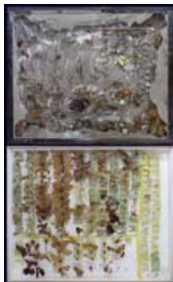
「被災した昆虫標本(上)と修復された昆虫標本(下)」 陸前高田市立博物館蔵

本展では、陸前高田市で行われた文化財レスキューや、世界的に見ても前例がなかった大量の海水損資料の処置法の開発について、処置が行われた約100点の資料とともに紹介します。また、地域の人々と資料とのつながりとおして、博物館の役割について皆様と一緒に考えていきたいと思います。よみがえった陸前高田の宝たちをぜひご覧ください。