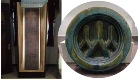
左は昭和時代に使われていた「山梨県庁」の看板 右はいまでも使われている「山」マークの瓦(かわら)

情報展示室には、県指定文化財になっ ている県庁舎別館にまつわる資料が展示 されています。 展示品を見たら、実際の建物の特徴をし らべてみよう。