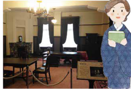
91年前にできたころの姿を再現した旧知事室。

きれいに再現されたむかしの知事室。 あしものふかふかじゅうたんから 山梨ならではの模様を見つけてみよう。 解説パネルのなかの建てられたころ の写真ともくらべてみてください。