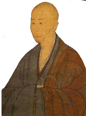
僧 A 〔 夢窓疎石 〕