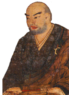
僧 B 〔 日蓮 〕