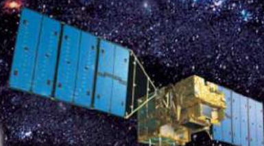
温室効果ガス観測技術衛星「いぶき」(GOSAT)