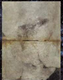
▲キトラ古墳天文図 (国・文部科学省蔵) ※展示は複製