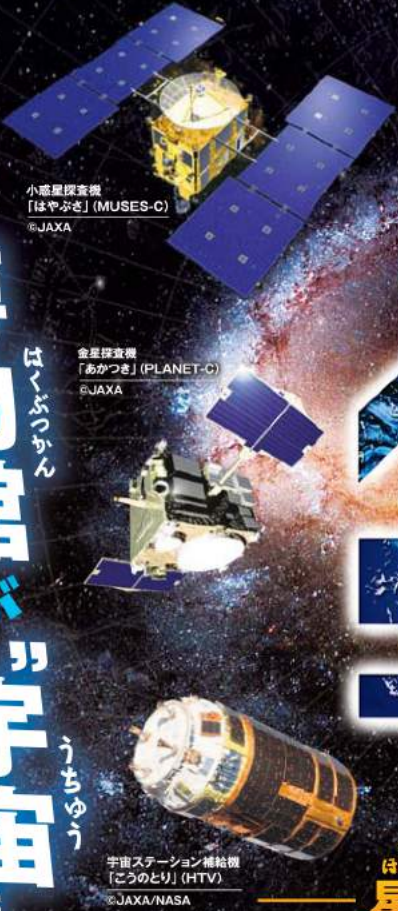
小惑星探査機「はやぶさ」(MUSES-C)