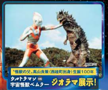
「怪獣の父」高山良策 (西桂町出身) 生誕100年 ウルトラマン vs 宇宙怪獣ベムラー ジョウマ展示!