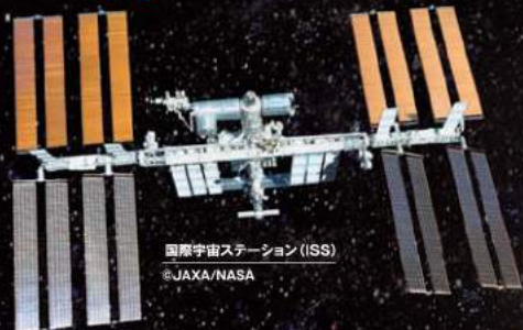
国際宇宙ステーション (ISS)