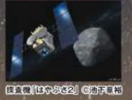
探査機「はやぶさ2」