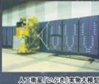
人工衛星「いぶき」実物大模型